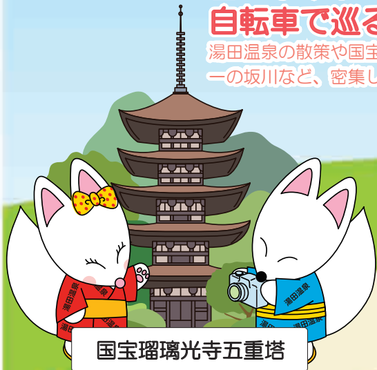
国宝瑠璃光寺五重塔

湯田温泉の散策や国宝瑠璃光寺五重塔、 一の坂川など、密集した市内の観光スポットへのアクセスに便利です！