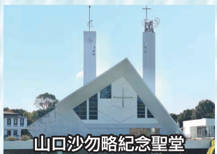
山口沙勿略紀念聖堂