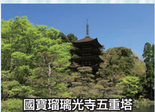
國寶瑠璃光寺五重塔