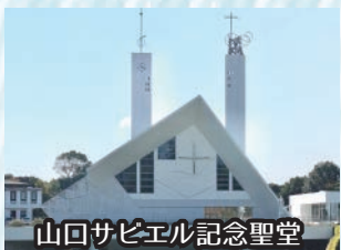
山口サビエル記念聖堂