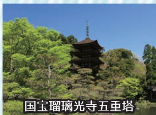
国宝瑠璃光寺五重塔