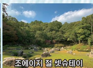
조에이지 절 셋슈테이