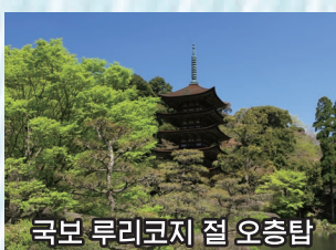
국보 루리코지 절 오층탑