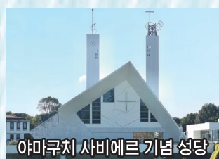
야마구치 사비에르 기념 성당

1, 2명은 택시(소형 또는 중형), 3명 이상은 점보택시를 이용합니다.