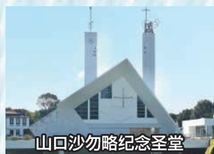
山口沙勿略纪念圣堂