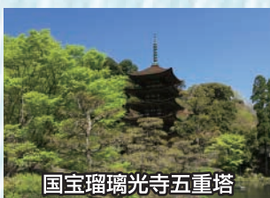
国宝瑠璃光寺五重塔