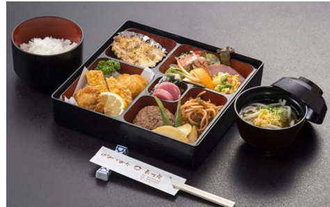
その他メニュー：洋風御前