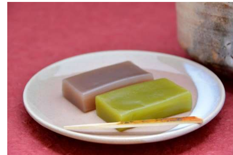
山口外郎(ういろう)

山口市民の誇り、山口外郎。「ういろう」の材料として、うるち米、米粉、小麦粉を用いる地区が多いですが、「山口外郎」は、わらび粉、でんぷんを用いて作られます。わらび粉、でんぷんによるふるふる食感は、老若男女問わずヤミツキになること間違いなし。