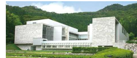
外観 (秋吉台国際芸術村)