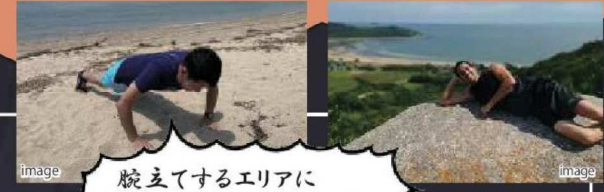
腕立てするエリアに 決まってるからおおおお