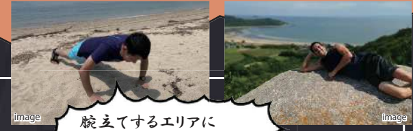
腕立てするエリアに 決まってんだろおおおお