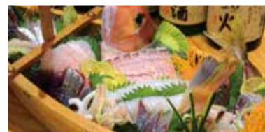
海の幸 Uminosachi Seafood 해산물 海鮮 海鮮