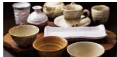
山口萩焼 Yamaguchi Hagi-ware 야마구치 하기가키 식기 山口萩陶器 山口萩焼