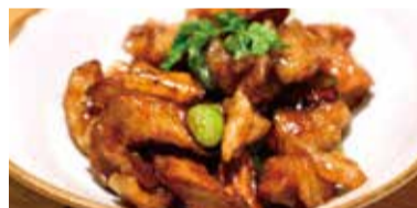
チキンチキンごぼう Chikin Chikin Gobou Chicken with burdock root 치킨 우엉 牛蒡鸡肉 牛蒡雞肉