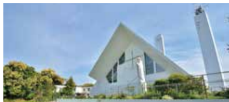
山口サビエル記念聖堂 Yamaguchi Xavier Memorial Church 야마구치 사비에르 기념 성당 山口沙勿略紀念聖堂 山口沙勿略紀念聖堂