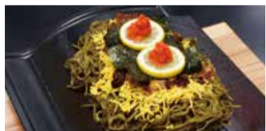
瓦そば Kawarasoba Kawarasoba noodles 가와라스바 국수 瓦片荞麥麵 瓦片蕎麥麵