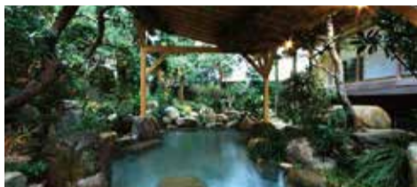
湯田温泉 Yuda Onsen Hot Springs 유다온천 汤田温泉 湯田温泉