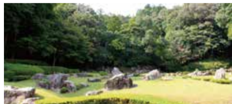
常栄寺雪舟庭 Jōeiji temple's Sesshūtei garden 조에이지 절 셋슈테이 常栄寺雪舟庭 常栄寺雪舟庭