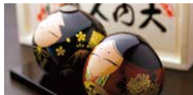
大内人形 Ōuchi dolls 오우치 인형 大内人偶 大内人偶