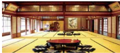
山口市菜香亭 Yamaguchi City "Saikōtei" 야마구치시 사이코테이 山口市菜香亭 山口市菜香亭