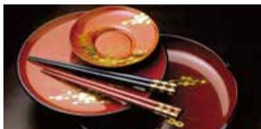
大内塗 Ōuchi-nuri lacquerware 오우치누리 大内涂 大内塗