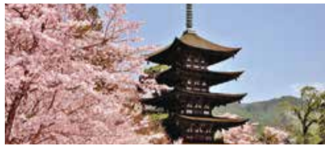
瑠璃光寺五重塔 (国宝) Rurikōji Temple and Five-Storied Pagoda (National Treasure) 루리코지 오층탑(국보) 琉璃光寺五重塔(国宝) 琉璃光寺五重塔(國寶)