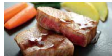
和牛 Wagyu Japanese beef 일본 소 和牛 和牛

お役立ち情報 | Useful Information | 유용한 정보 | 有用信息 | 有用資訊