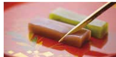
外郎 Uirō (traditional confectionery) 우이로 外郎 外郎糕