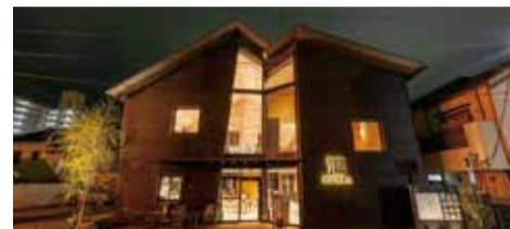
湯田温泉観光回遊拠点施設「狐の足あと」 Tourist Info., Café & Rest space "Kitsune no Ashiato" 유다온천 관광유람 거점시설 기쓰네노 아시아토 汤田温泉观光游览据点 狐之足迹 湯田温泉觀光遊覽據點 白狐的足跡

特産品 | Local Specialties | 지역 특산물 | 当地特色菜 | 當地特色菜