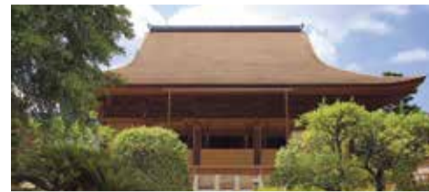
龍福寺 Ryūfukuji Temple 류후쿠지 절 龍福寺 龍福寺