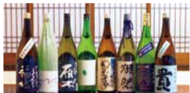
地酒 Local sake 토속주 本地酒 在地酒

特産品 | Local Specialties | 지역 특산물 | 当地特色菜 | 當地特色菜