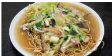
ぱりそば Barisoba Barisoba noodles 바리스바 국수 香脆荞麥麵 香脆蕎麥麵