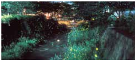
一の坂川エリア Ichinosaka River Area 이치노사카가와 강 지역 一之坂川地区 一之坂川地區