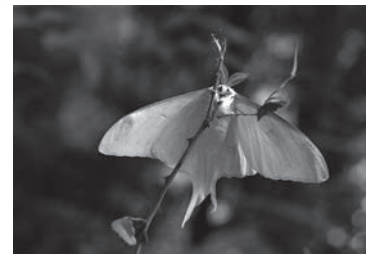
《羽化したオオミズアオー萩市川上ー》 シリーズ「結界」より 作家蔵 © Shimose Nobuo