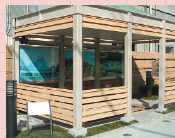
1・観光案内所前 (9時~22時)

※「大昔、白い狐が温泉に浸かり、傷を癒した」という伝説があるので、湯田温泉には白い狐の像がたくさん設置されています。