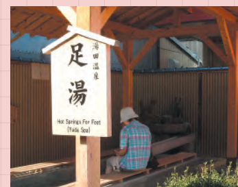
3・湯の町通り (10時~22時)