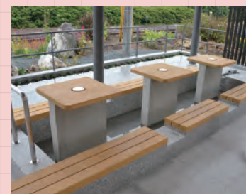
6・湯田温泉駅前 (10時~22時)