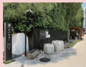
2・湯の香通り (10時~22時)