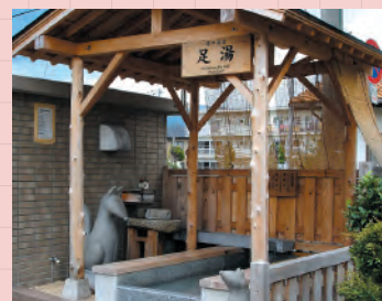
4・サンフレッシュ山口 (9時~20時)