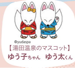
【湯田温泉のマスコット】 ゆう子ちゃん ゆう太くん

1日に2000トンもの天然温泉が湧き出る湯田温泉。「美肌の湯」のまちとして親しまれるのはもちろん、幕末に活躍した維新の志士たちとゆかりの深い地であること、詩人・中原中也を生んだ地であること、また、俳人・種田山頭火が愛した温泉であることから、広く知られています。歴史と文化と温泉が楽しめるまちに、ようおいでした!