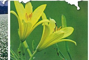
04 ゆうすげ / 船平山 C-11