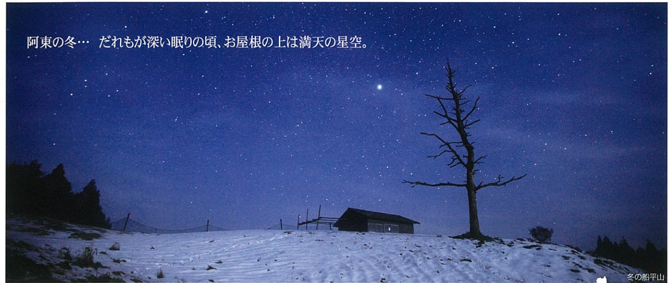
阿東の冬... だれもが深い眠りの頃、お屋根の上は満天の星空。