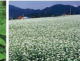
蕎麦の花 / 徳佐