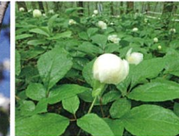
05 山しゃくやく / 十種ヶ峰 B-10