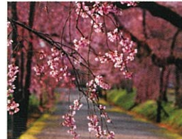
01 しだれ桜 / 徳佐八幡宮 E-9