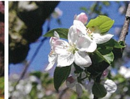
ひんごの花 / 徳佐